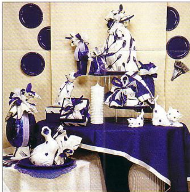
LUNCH, una vetrina elegante e originale decorata da posate in plastica, arricchita da candele e ceramiche.

Via degli Ulivi, 2 - 61030 Tavernelle di Serrungarina (PS) Tel. e Fax 0721 891448