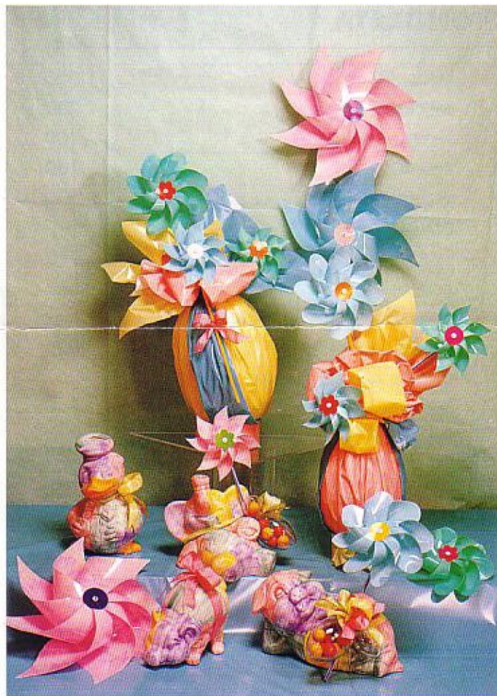
Per una Pasqua ironica e divertente la Fabbrica dei Sogni propone tante girandole sui temi del rosa-azzurro.

La curiosità verso l'evoluzione del gusto e degli stili porta la Fabbrica dei Sogni ad esplorare nuovi materiali e forme. Non è un gioco ma un progetto per costruire, attraverso sottili cambiamenti, uno stile un po' poetico ed ironico, sempre raffinato.